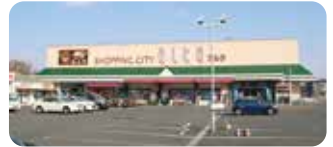
●ショッピングシティアルタ新栄店...約200m