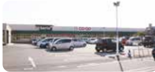
●コープさが新栄店...約750m